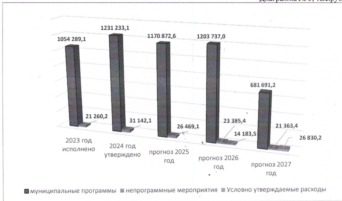
Диаграмма № 3, тыс.руб.

Снижение расходов в абсолютных и относительных значениях по отношению к показателю предыдущего года составит в 2025 году – 65 033,5 тыс.руб. или 5,2%.