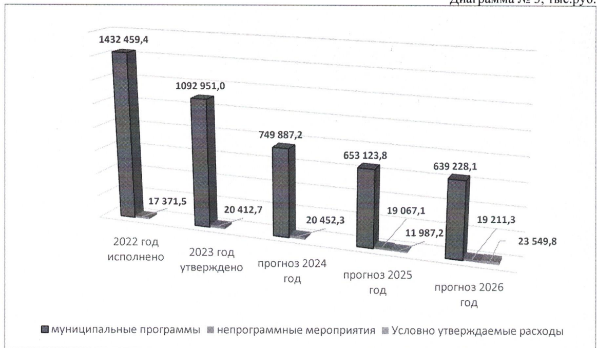
Диаграмма № 3, тыс.руб.

Снижение расходов в абсолютных и относительных значениях по отношению к показателю предыдущего года составит в 2024 году – 343 024,2 тыс.руб. или 30,8%.