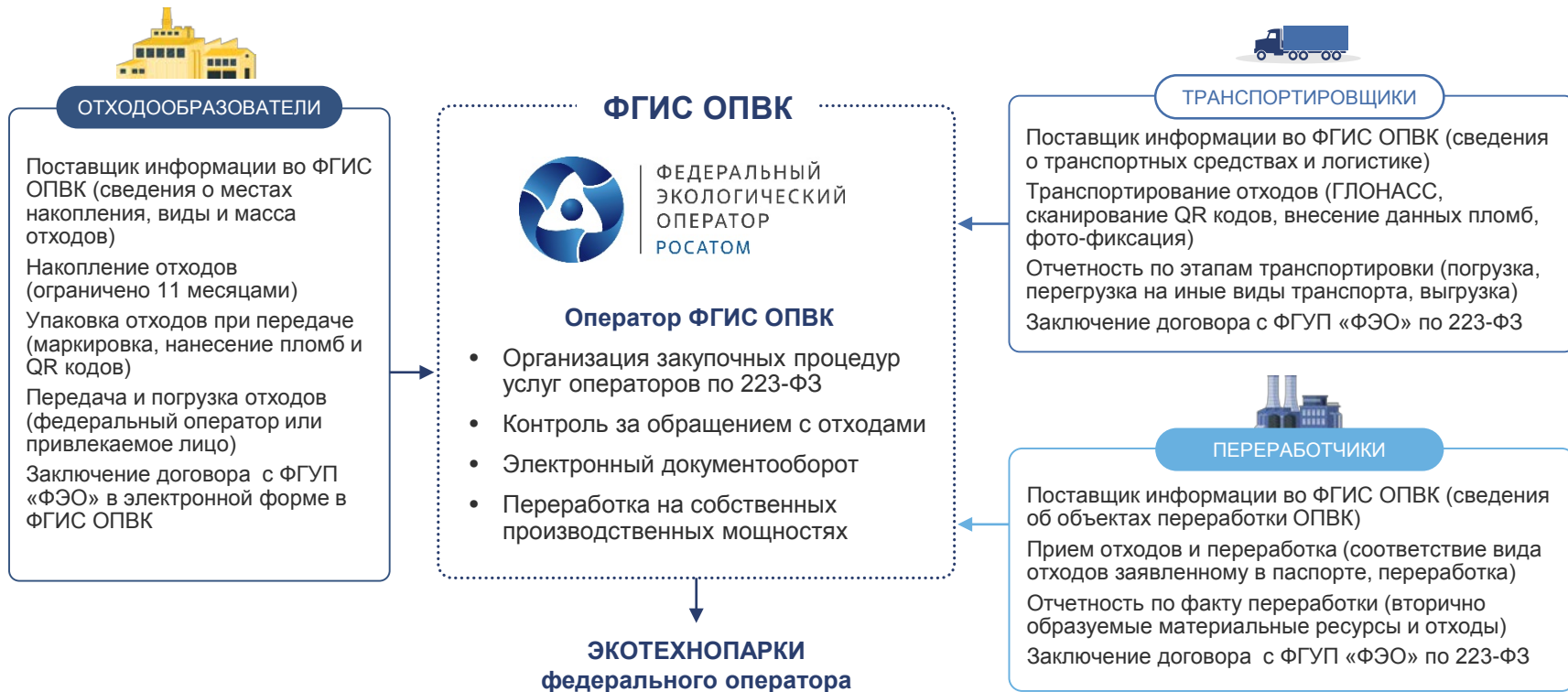
Схема обеспечения учета и контроля за обращением с отходами I-II классов опасности (постановление Правительства РФ № 1346 от 18.10.2019)