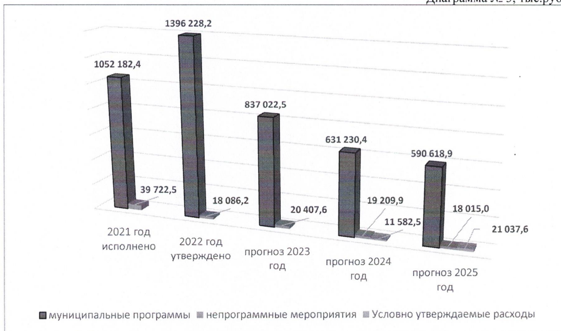
Диаграмма № 3, тыс.руб.

Снижение расходов в абсолютных и относительных значениях по отношению к показателю предыдущего года составит в 2023 году – 556 884,3 тыс.руб. или 39,4%.