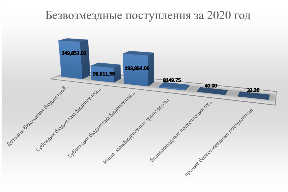
Диаграмма № 4 (тыс.руб.)

Показатели исполнения доходной части бюджета ЗАТО город Заозерск в разрезе межбюджетных трансфертов, относительно утвержденных бюджетных назначений, а также в сравнении с 2019 годом представлены в таблице № 8.