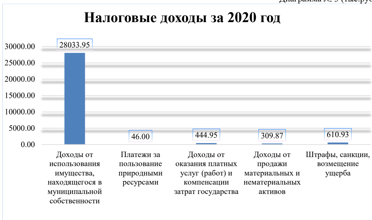
Диаграмма № 3 (тыс.руб.)

Показатели исполнения доходной части бюджета ЗАТО город Заозерск в разрезе неналоговых доходов, относительно утвержденных бюджетных назначений, а также в сравнении с предшествующим годом представлены в таблице № 7.