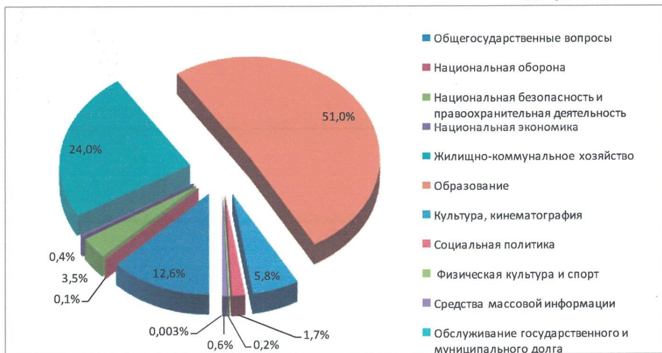
Диаграмма № 6

Анализ расходов бюджета ЗАТО город Заозерск Мурманской области по разделам бюджетной классификации показал, что средний уровень освоения общего объема законодательно утвержденных бюджетных ассигнований в 2018 году составляет 96,34 % .