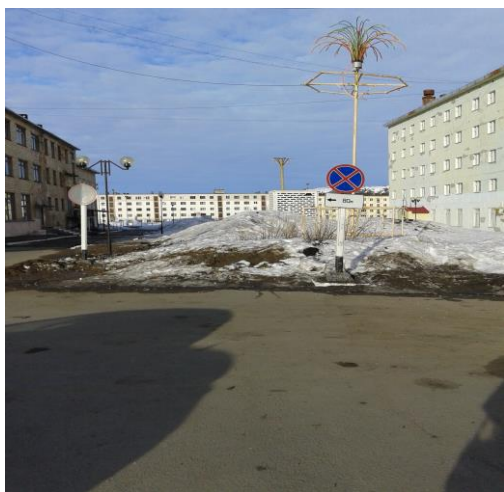
После проведения 1 этапа работ: