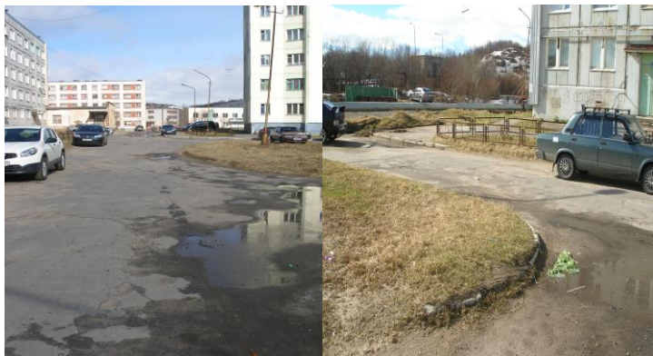
После проведения 1 этапа работ: