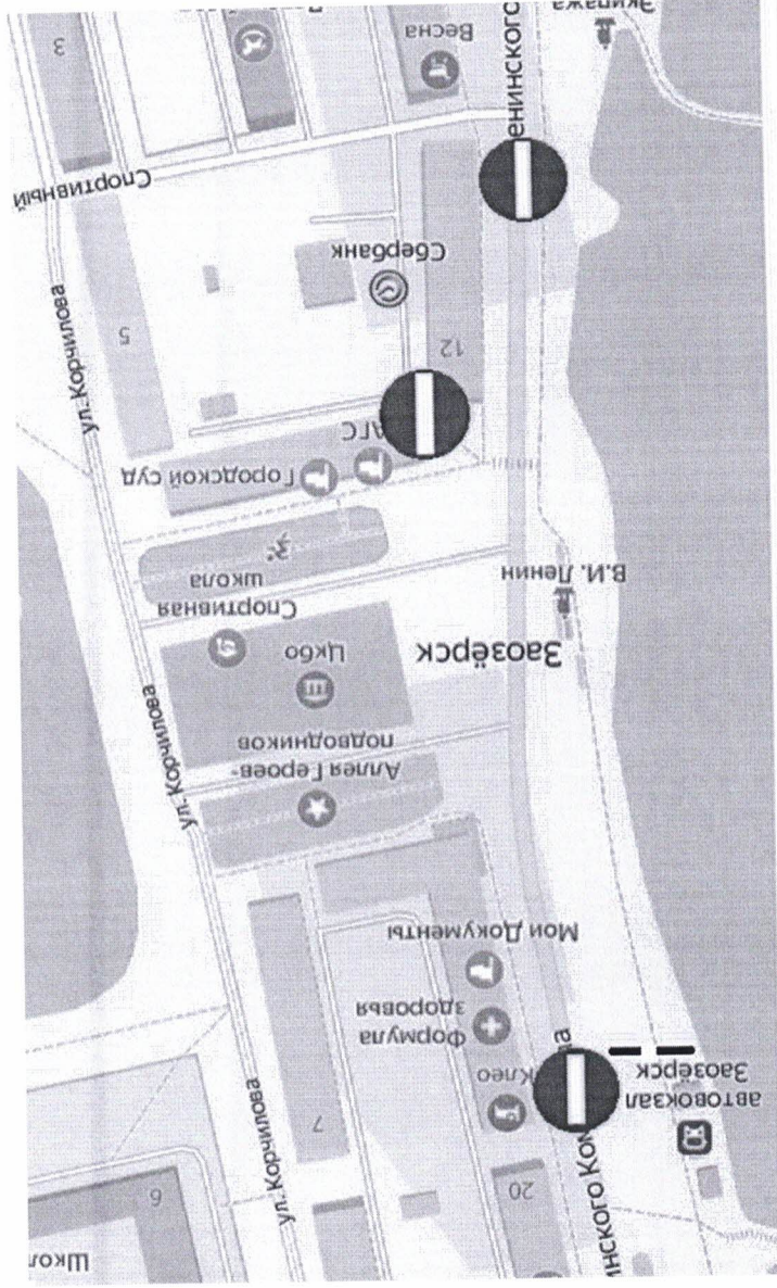
Схема перекрытия дорожного движения с 16:30 до 21:00 23 июня 2024 года в период проведения Дня молодежи в ЗАТО город Заозерск

УТВЕРЖДЕНА постановлением Администрации ЗАТО город Заозерск от 04.06.2024 № 354