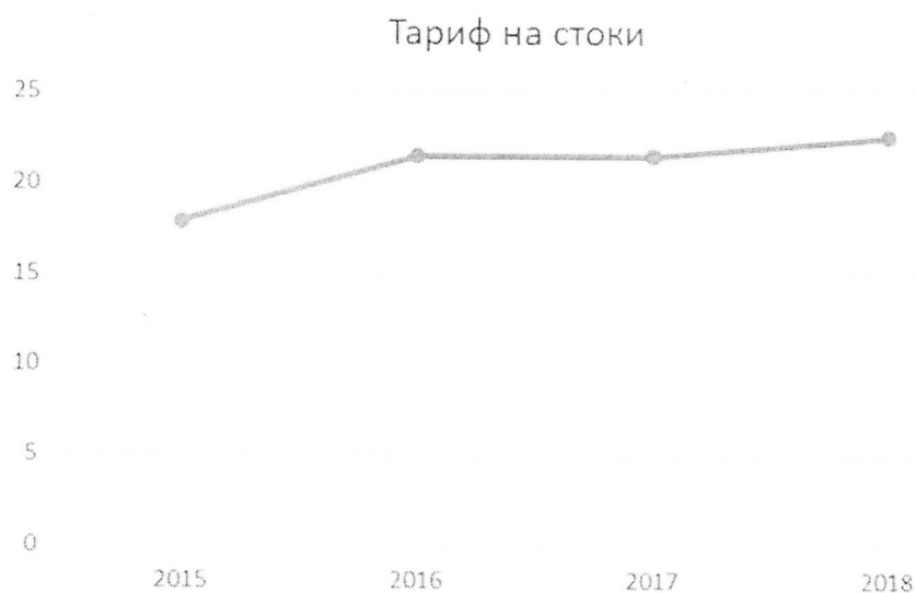
Диаграмма 4. Динамика изменения тарифа на водоотведение с 2015 года по 2018 год, руб./куб.м.

В ЗАТО город Заозерск в последние годы имеет место устойчивая тенденция на повышение стоимости энергетических ресурсов. В ситуации, когда энергоресурсы становятся рыночным фактором и формируют значительную часть затрат бюджета ЗАТО город Заозерск, возникает необходимость в энергосбережении и повышении энергетической эффективности зданий, находящихся в муниципальной собственности, пользователями которых являются муниципальные учреждения (далее – муниципальные здания), и в выработке политики по энергосбережению и повышению энергетической эффективности.