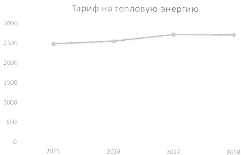
Диаграмма 2. Динамика изменения тарифа на тепловую энергию с 2015 года по 2018 год, руб./Гкал