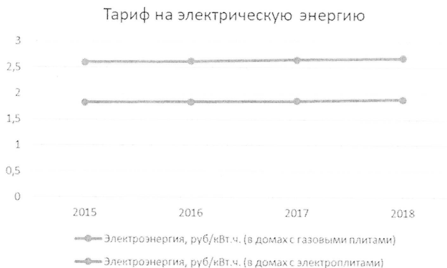
Диаграмма 1. Динамика изменения тарифа на электроэнергию с 2015 года по 2018 год, руб./кВт*ч

На диаграммах 1-4 представлена динамика изменения стоимости коммунальных ресурсов с 2008 года по 2011 год.